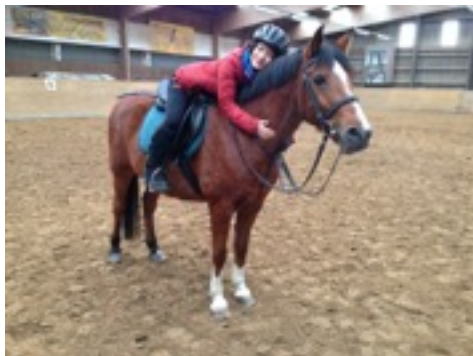
* 大學體育課的馬術課 冬天騎馬特別冷，但抱著馬就暖起來了