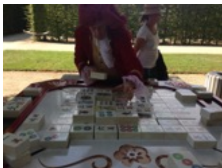
* 德勒斯登著名城堡皮爾尼茨宮東方文化展覽