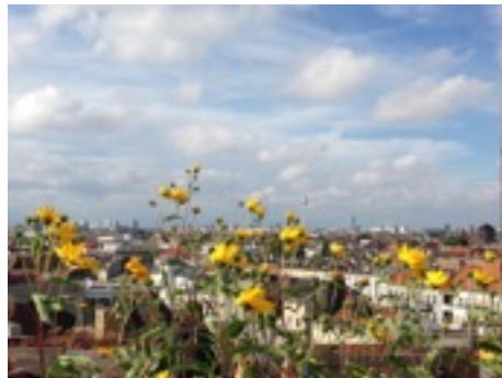
＊頂樓停車場上的花園，能俯視整個柏林