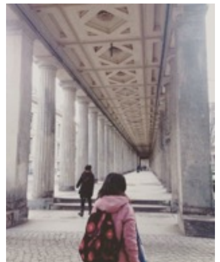
＊柏林的世界遺產-博物館島上壯觀的希臘式神柱走廊