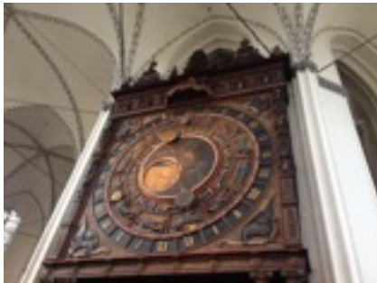
* 聖母教堂中的天文鐘

當然課程內容偏易，但老師全德文授課，還是能學到不少，於是我把注意力放在聽老師講話，仔細聽他如何使用文法、使用各種單字及句子的結構，加上每天上課至少會有三分之一的時間是分組討論，以及將討論內容分享給全班，透過不斷的練習，很快的大家不再懼怕講德文，甚至下課時間和不同國家來的同學聊天的語言也從英文轉為德文。雖然一開始心裡對初級的課程有排斥，但發現上課模式和台灣很不同，非常新鮮，加上每天都有不同的挑戰，完全不會感到無聊，不只是學語言，還必須常常思考許多對文化跟日常生活上的想法及分享自己國家風土民情，並用德語介紹給同學和老師們，也許初級的文法我已經都學會了，但是經過每天不斷地使用，這些課本上