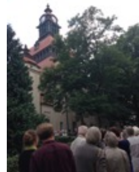
* 莫里茨城堡藝術節-為了聽音樂會，德國人排了快四十公尺長的隊伍