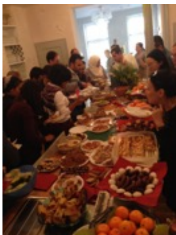
* 整個語言班一起慶祝聖誕節：交換禮物跟都是甜食的大餐

這半年中，有點遺憾語言程度無法進入大學部上課，每天密集的語言課程，還是讓我收穫很多，除了知識學習和文化差異上的體驗外，改變最多的是自身的成長。在台灣就算成年了，但在大學階段還是常常會慣性依賴父母或大學的老師，但在德國一切大小事都得自己處理，有時遇到突發狀況，沒有人能諮詢時必須要自己解決，因此發現其實生活上許多大小事都能自理，並不需要依靠別人。一個人隻身在國外時難免有時會比較脆弱、想家，但這種時候反而更能讓自己成長，也更確定自己畢業後想再回來讀書的念頭。我認為在大學時期能有一段當交換學生的經驗非常可貴，除了能讓視野更廣擴之外，還能借此橫量自己未來的可能性。我很感謝我的父母和學校給了我這個機會當半年的交換學生。