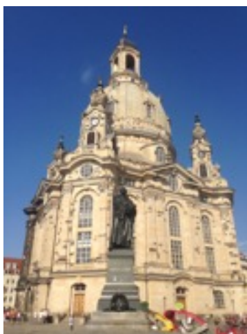
* 德勒斯登著名景點聖母教堂