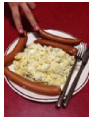
* 平安夜大餐：馬鈴薯沙拉跟德國香腸