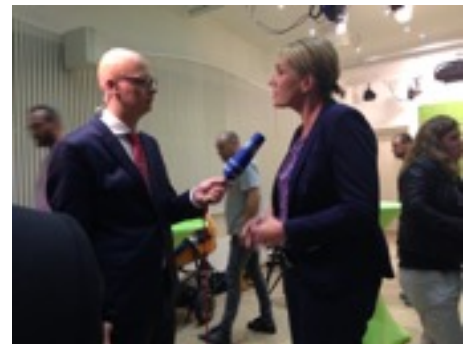
＊旅遊期間遇到柏林選舉，在報社實習的朋友帶我到綠黨總部觀看選情