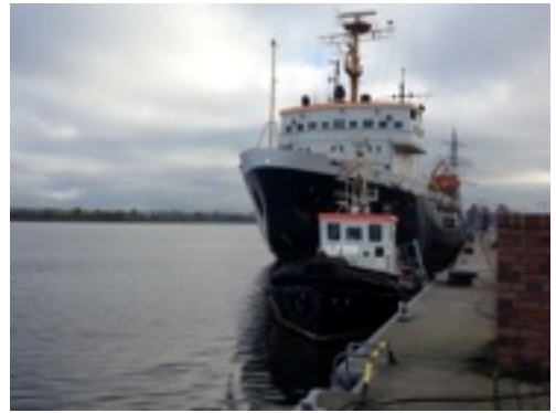
* 羅斯托克港邊停靠的破冰船

說只是考試要背的公式，跟生活沒有關係，講出來的話或是寫出來的作文很可能只是一堆以德文單字及中文語法組成的句子，或是完全不知道怎麼說或怎麼寫，因為沒有框框讓他們填寫或指示這裡要用哪一種時態或哪種句型。十一月底，考完試後進入中級的課程，雖然在台灣我已經修過中級前半部的課了，但在這邊同一等級的課跟在台灣的大學課程難度相差很多，我覺得最有挑戰的部分是，課本中每一課會有討論主題，例如：小孩該不該看電視、環保