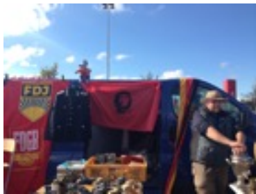
* 二手市集的軍用品攤位

議題、男女關係等等，同學會被分成兩組，進行辯論。雖然事先會準備，但對方突如其來的反駁和問題可能會一時無法招架，導致辯論難以繼續，這時就是考驗我們德文應變能力的時候了。