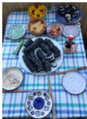
* 和朋友一起在家做壽司