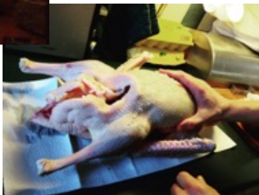
* 聖誕節大餐的主食烤鴨準備中