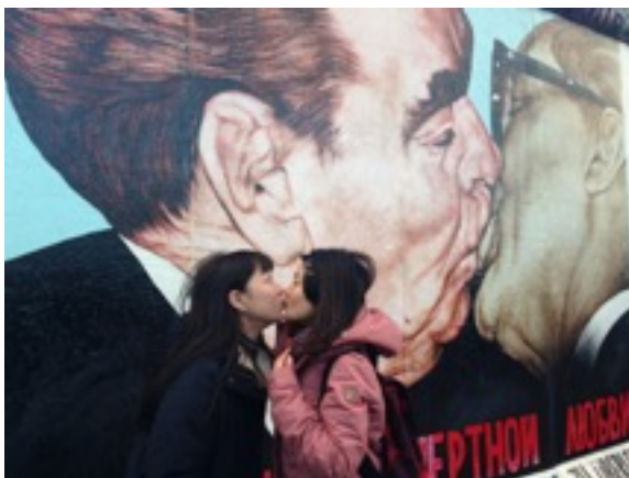
＊柏林圍牆的東區藝廊最有名的塗鴉，我的朋友說這張照片是：社會主義兄弟之吻v.s.女性主義姊妹情深