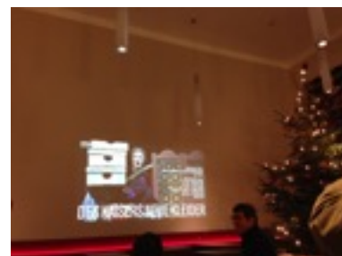
* 聖誕節前夕，老師帶我們去看舞台劇-國王的新衣

這半年中，有點遺憾語言程度無法進入大學部上課，每天密集的語言課程，還是讓我收穫很多，除了知識學習和文化差異上的體驗外，改變最多的是自身的成長。在台灣就算成年了，但在大學階段還是常常會慣性依賴父母或大學的老師，但在德國一切大小事都得自己處理，有時遇到突發狀況，沒有人能諮詢時必須要自己解決，因此發現其實生活上許多大小事都能自理，並不需要依靠別人。一個人隻身在國外時難免有時會比較脆弱、想家，但這種時候反而更能讓自己成長，也更確定自己畢業後想再回來讀書的念頭。我認為在大學時期能有一段當交換學生的經驗非常可貴，除了能讓視野更廣擴之外，還能借此橫量自己未來的可能性。我很感謝我的父母和學校給了我這個機會當半年的交換學生。