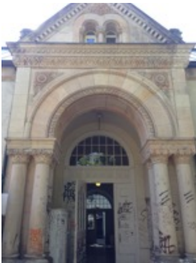
＊柏林藝術大學的建築古典風格混合了現代塗鴉

九月我成了觀光客，首先在德國首都柏林待了一週，除了到各個知名景點走走外，有時就是漫無目的地在城市裡到處晃晃，感受這裡的氣氛，在城市的個角落也能發現許多驚喜，例如演奏著從來沒看過的樂器的街頭藝人、特別的市集或是藝術學院學生的展覽等等。雖然一週不短，但想看遍柏林不帶遺憾的離開根本不夠，這裡有太多有趣的事情不停地發生。相較於德國其他城市柏林非常得國際化，走在路上四面八方傳來的語言都不同，難說誰是哪國人誰從哪裡來，反正大家都生活在柏林，只會講英文也能在此過上方便無慮的生活，很特別的是本國人跟外國人的界線變得很模糊，生活和工作上也比較不會出現差別待遇，使外國人容易產生對這個城市的認同感。接下來到瑞典和英國訪友就暫且不提了。